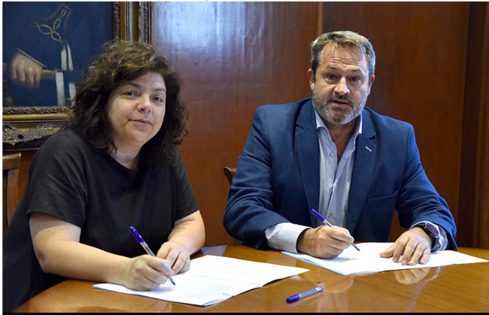
Carla Vizzotti, ministra de Salud de la Nación y Damián Sudano, presidente de FEFARA

Entre las líneas de acción propuestas se encuentra la concientización sobre el uso racional de medicamentos, la prescripción de medicamentos por nombre genérico, y la promoción de lineamientos que conlleven a una efectiva resistencia antimicrobiana.